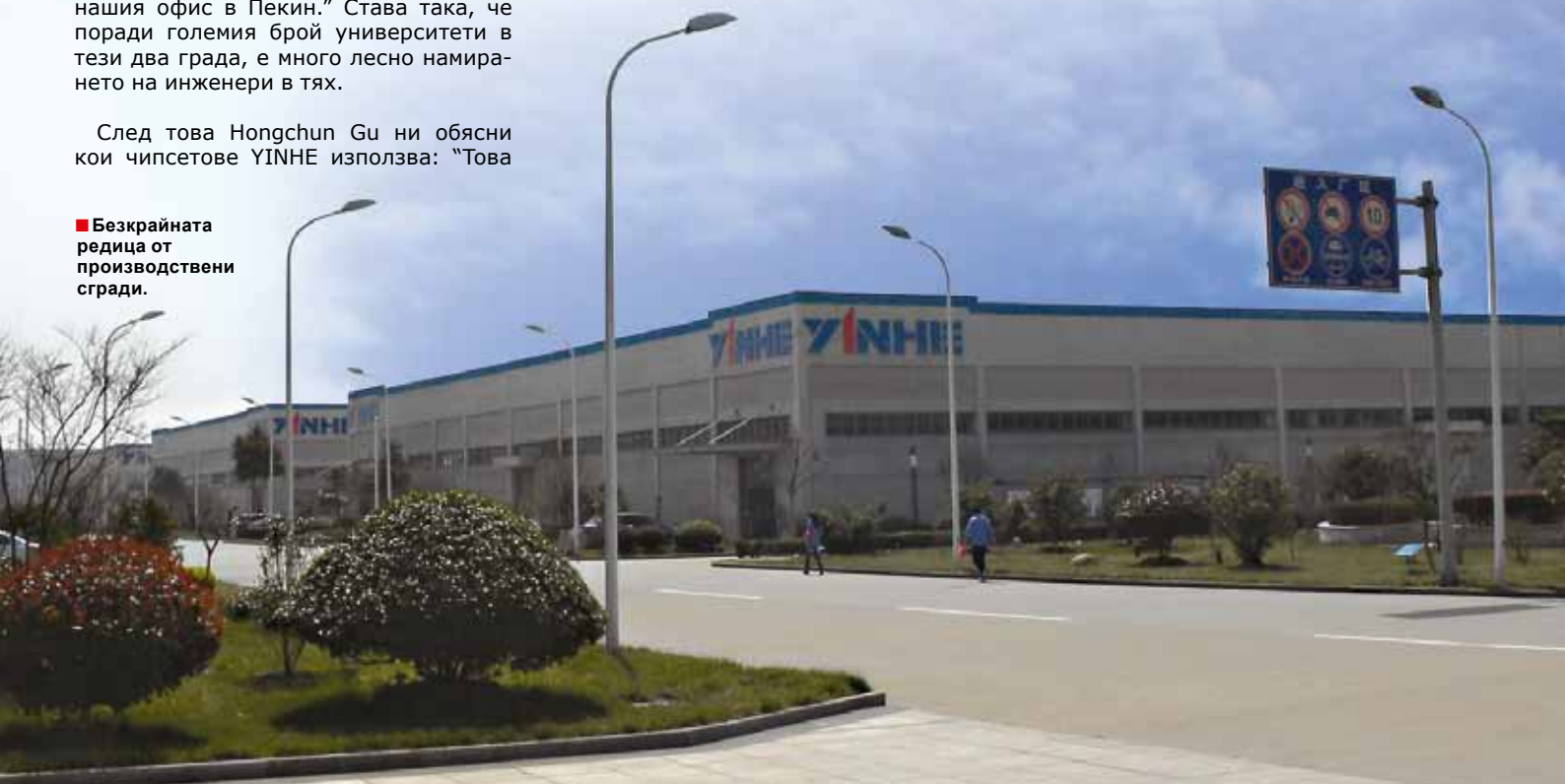
■ Безкрайната редица от производствени сгради.

Това е доста впечатляващ списък, но той не свършва до тук. Досега бяха споменати само сателитни приемници, но YINHE планира също и производството на ефирни. "Току що пуснахме на пазара DVB-T MPEG-4 PVR приемник с HD и двоен тунер", разкри за нас