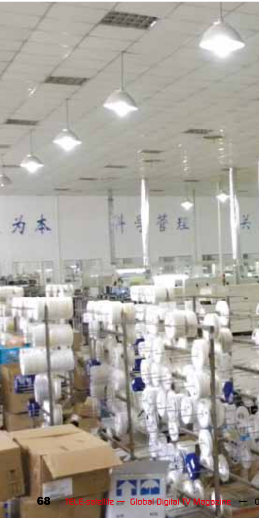
■ В другия край на залата се намират ролките със SMT компонентите, които непрекъснато се подават към автоматичните SMT машини от служител на компанията. Тези машини работят денонощно, без прекъсване. На стената отзад е написано: "Работете с Вашите колеги-приятели; Добро управление; С поглед към клиента; Непрекъснат прогрес".

Ето как компанията YINHE се подготвя за бъдещето!