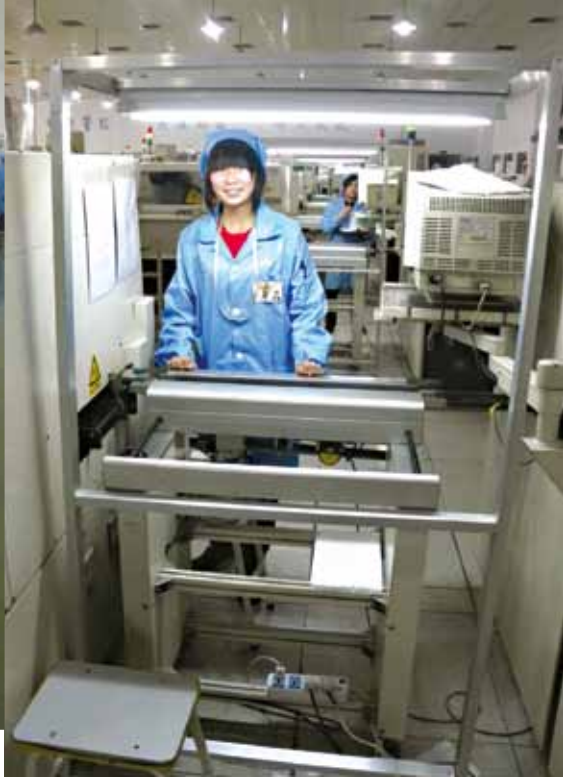
■ Една от служителките в SMT залата; тук тя следи една от автоматичните машини.